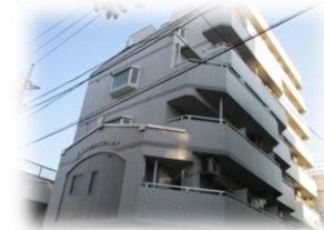
フローレンス八王子外観

安全で快適な女子学生会館を選ぶなら、フローレンス八王子は新入生に最適な設備を備えた建物です。