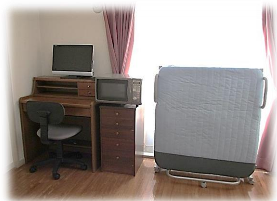
家具・家電の無料リースの一例(個室の写真)