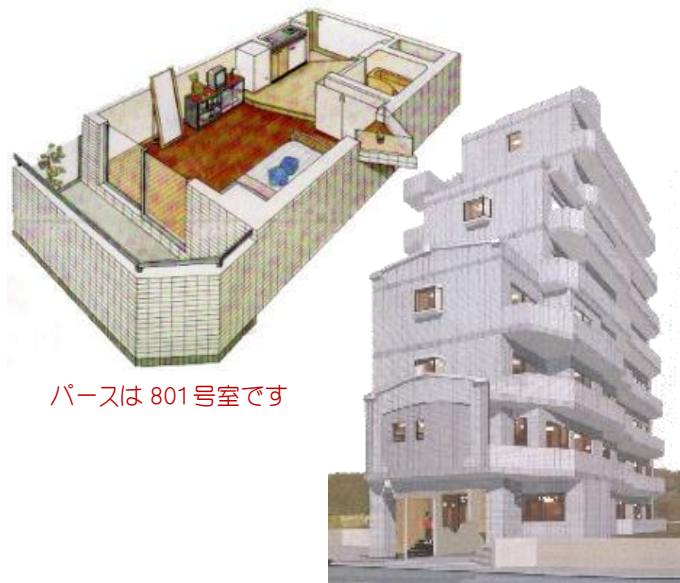
パースは 801 号室です

ジャパンネット銀行 本店営業部(支店番号 001) 普通口座 □座番号:8207818 名義人 :有限会社恵住宅サービス [ユ]メグミジユウタクサービス 予約金額 :50,000 円