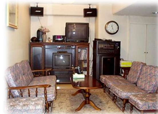
共用の地下パーティールーム