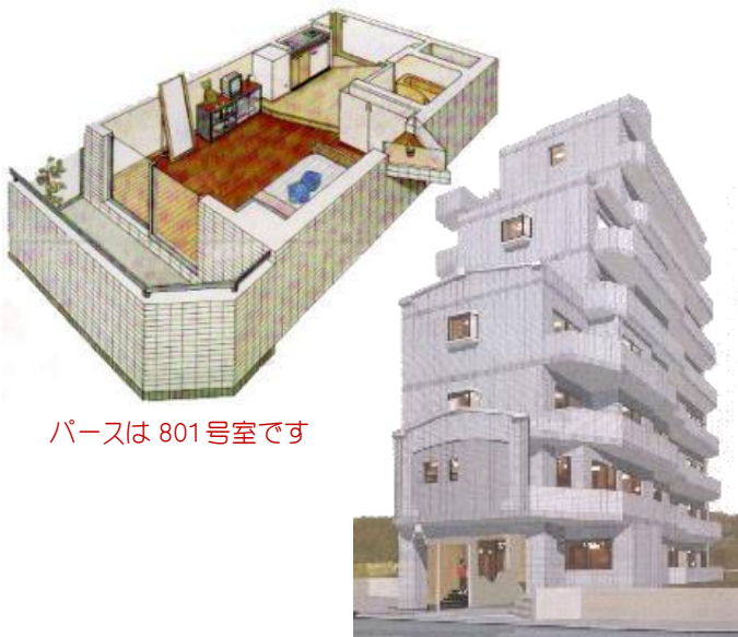
パースは 801 号室です

ジャパンネット銀行 本店営業部(支店番号 001) 普通口座 □座番号:8207818 名義人 :有限会社恵住宅サービス [ユ]メグミジユウタクサービス 予約金額 :50,000 円