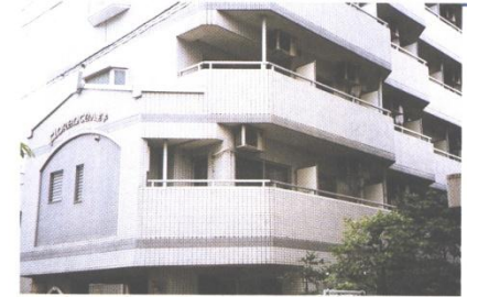
フローレンス八王子外観

『女子学生会館フローレンス八王子』は学生生活に必要な設備と家具、家電、インターネット環境を提供する学生会館です。プライバシーを守る個室と女性の管理人によるサービス、就職や資格取得に必要な授業以外の専門的学習に門限を気にしないで勉強できる環境と好評です。安全で快適な女子学生会館を選ぶなら、フローレンス八王子は新入生に最適な設備を備えた建物です。