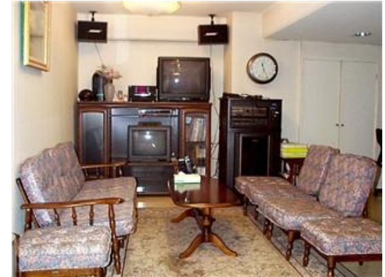
共用の地下パーティールーム