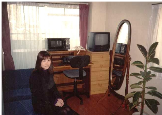
家具・家電の無料リースの一例(個室の写真)